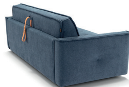
Vista posteriore Rear view - Vue arrière - Vista trasera